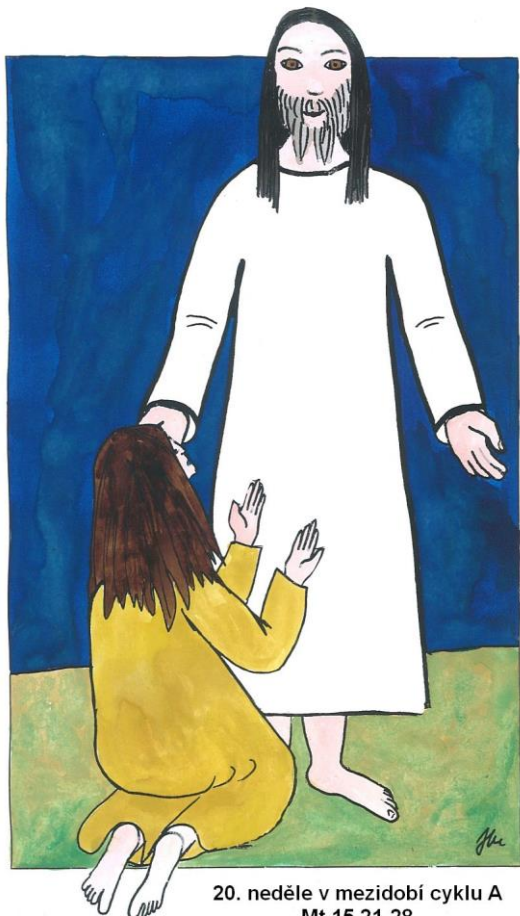
20. neděle v mezidobí cyklu A Mt 15,21-28