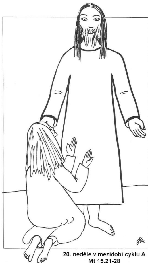
20. neděle v mezidobí cyklu A Mt 15,21-28